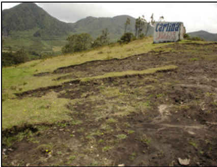
Extracción ilegal de tierra