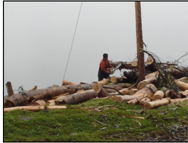
Extracción de Recursos