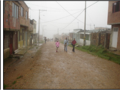
Sin Inversión - Barrios Sin Legalizar