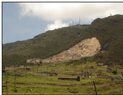
Minería - Canteras